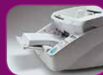
Position intermédiaire (300 feuilles)