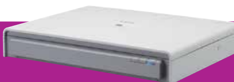
Glace d'exposition A3 Flatbed 201