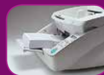
Position basse (500 feuilles)