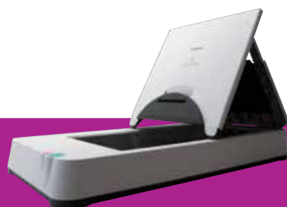
Glace d'exposition A4 Flatbed 201

Numérisez des livres reliés, des journaux et des supports délicats en ajoutant la glace d'exposition Flatbed 101 pour les documents jusqu'au format A4 ou la glace d'exposition Flatbed 201 pour la numérisation en A3. Dotées d'une connexion USB, ces glaces d'exposition s'intègrent parfaitement avec les DR-G1100 et DR-G1130 afin d'assurer un traitement parallèle très fluide, appliquant systématiquement les mêmes fonctions d'amélioration des images pour chaque numérisation.