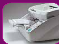
Position haute (100 feuilles)

Le chargeur de documents dispose de trois modes sélectionnables (100, 300 et 500 feuilles) qui permettent de s'adapter au volume des lots à numériser, afin de gagner du temps et d'améliorer le rendement.